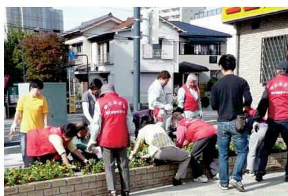
駅周辺での花の植栽

(5) 緑化意識の向上と、区民同士のふれあいや絆を深めることを目的とした、身近な場所での緑に出会う機会の創出が求められています。