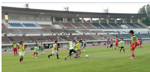
女子サッカー教室IN浦和駒場スタジアム

また、サッカーやうなぎのまちとしての特性などを生かした区の魅力の向上と情報発信力の強化が必要です。