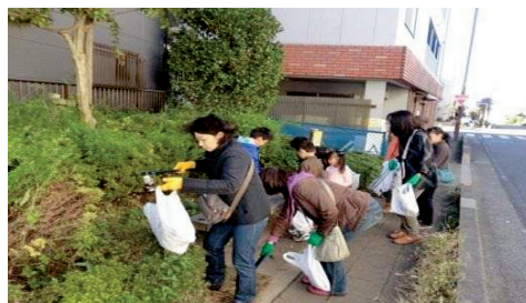
浦和区ごみゼロ運動

(1) 世代や文化、居住する地域など様々な差異を超えて人々がふれあい、誰もが楽しく活動し、人々の理解と共感が広がるまちづくりが求められています。