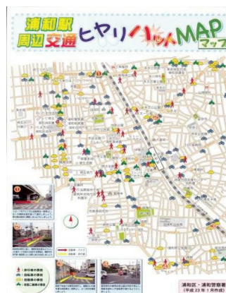
ヒヤリハットマップ

(4) 犯罪や交通事故のない安全で安心して住めるまちの構築が求められています。特に高齢者や子どもなど交通弱者への安全対策が重要です。