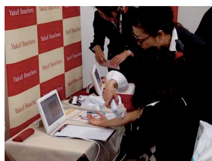
浦和区健康まつり

(6) 生活習慣病予防や介護予防など、健康・福祉に関する取組の充実が求められています。